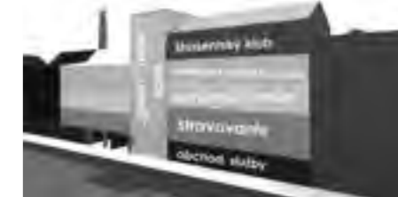
Dominika Vyhlidalová: Návrh – funkčné členenie objektu bývalej varne so silom.