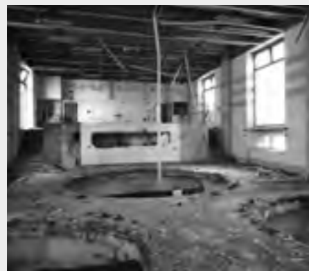
Variňa (1943 – 1944)

O novom vlastníkovi Steinu – spoločnosti Dream-Field Property, s.r.o., ktorá vznikla v júli 2013, nie je známe, či sa niekedy zaoberala obnovou historického architektonického dedičstva. Návrh zástavby územia pivovaru od architekta I.K. jestvoval už pred kúpou (na dražbe pozemkov – ako akéhokoľvek iného tovaru – za dvojtretinovú cenu vyhlásenú exekútorom). PÚ SR oznámil novému vlastníkovi (listom z 24. 6. 2013) začatie správneho konania vo veci vyhlásenia objektov v Steine za národné kultúrne pamiatky (NKP). Upozorňoval, že už roku 2010