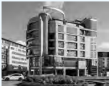
Ivan Marko, Marta Kropiláková: Slovenská sporiteľňa, 1994. Stav pred prestavbou.

Novovzniknutý náročný objekt Slovenskej sporiteľne, sa stal jedným z identifikačných znakov a orientačných bodov tejto časti mesta. Reprezentatívny charakter a veľkolepo riešený mestský parter s obchodnou pasážou aj rozloženie funkcií objektu bolo v súlade s mestským charakterom prostredia. Bohato členitá fasáda s organicky zaoblenými líniami a až sochárskym tvarovaním hmôt, dodávala objektu banky dynamický charakter korenšponujúci s protihlým barokovým priečelím Grassalkovičovho paláca. Aj použitie stavebného stavebného materiálu v podobe mramorových obkladov v parteri, oceľových okenných rámov, zrkadlových skiel a vysokolešteného chrómového obkladu stĺpov, poukazovalo na reprezentatívny charakter budovy banky. Výraz objektu dobre dokladoval dobové uvažovanie autorov o tvorbe architektúry: