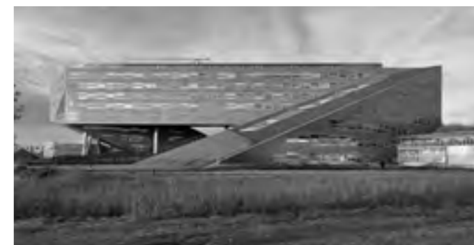
Ing. arch. Tatiana Buijs – Vitková / Uytengaak: Linnaeusborg, Groningen, 2010.