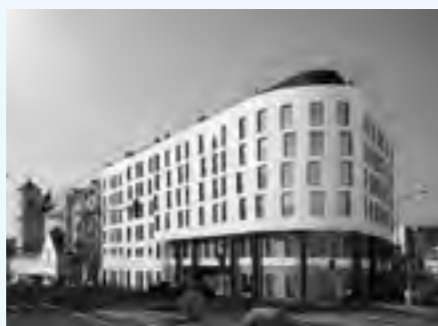
Vizualizácia budúcej podoby „Modrej gule“.