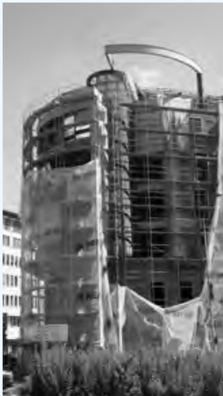
Priebeh prestavby, júl 2014.

Na poslednom uskočenom 6. podlaží bola navrhnutá vyhladková reštaurácia, nazvaná podľa niekdajšej predajne – „Modrá guľa“. Názvu sa vizuálne prispôbil aj interiér reštaurácie. Išlo o nevelký, okázalo pôsobiaci