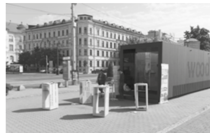
Prezentácia Spolku architektov Slovenska vo Woodbox-e na nábreží Dunaja v rámci festivalu Wooddays, v spolupráci s proLignum – Námestie Ľ. Štúra v Bratislave, 29. 4. 2014.