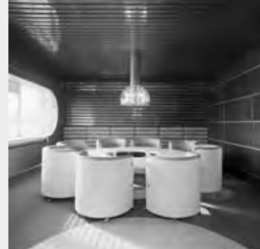
Vládny salónik v starej budove letiska 1972 – 73. Autori : prof. Vojtech Vilhan, Ján M. Bahna.