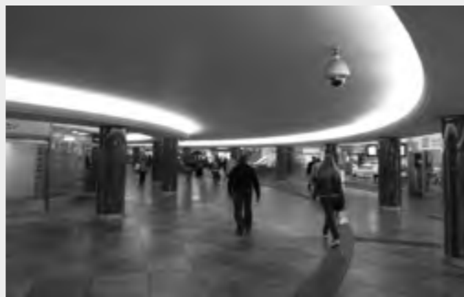
Pamiatkovo chránený prvý podchod pri opere vo Viedni z roku 1955

Súčasne bol obnovený pôvodný architektonický výraz pamiatkovo chráneného podchodu pod operou, ktorý bol otvorený v roku 1955 v predvečer vyhlásenia nezávislosti Rakúska a odchodu sovietskych