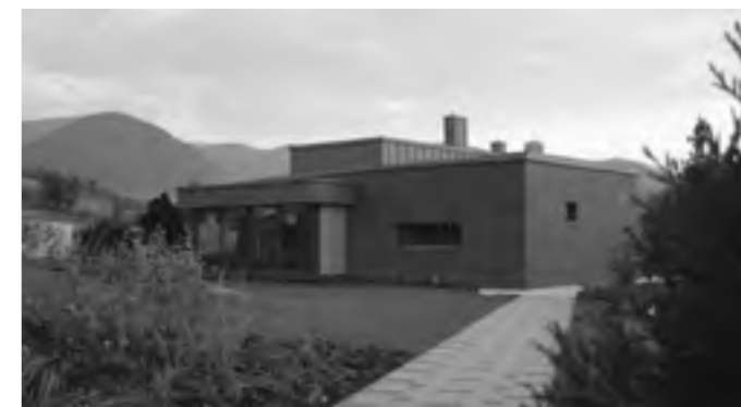
Ing. arch. Lúbia Koreňová: Rodinný dom, Trnové, 2009.