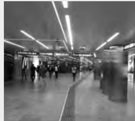
Kulturpassage dlhá vyše 200m vedúca od opery na Karlsplatz, 2013

Popri rozšírení a jasnom štruktúrovaní pasáží prišli architekti s ideou pasáže ako „kultúrnej míle“, ktorá by prepájala ako živý mestský priestor susediace kultúrne zariadenia i inštitúcie. Künstlerhaus, Wien Museum, Kunsthalle, Secession by mali byť na základe umeleckej súťaže prepojené tak, aby Karlsplatz bol ako umelecké centrum komponované aj pod povrchom.