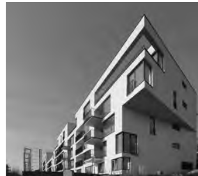
Ing. arch. Michaela Hantabalová / Hantabal architekti: Minergo, Bratislava – Koliba, 2010.