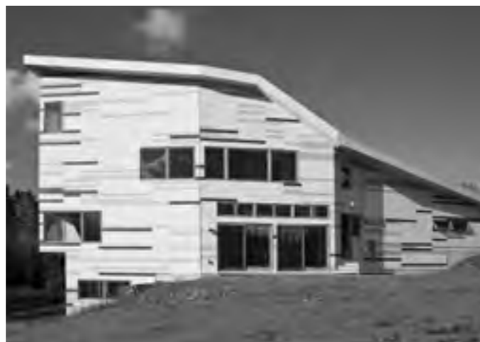
Ing. arch. M. arch Dana Čupková: Hsu House, New York, 2010. Spoluautor: Kevin Pratt.