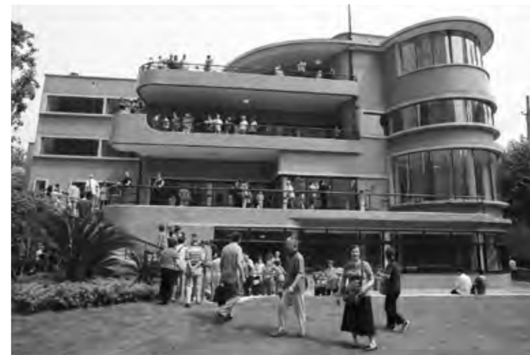
Otvorenie Hudecovej vily Dr. Woo verejnosti, jún 2014.

Vila bola v čase dokončenia označovaná ako najlepší príklad tzv. západnej architektúry v celej juhovýchodnej Ázii. Veľkorysý priestorový koncept s bohato