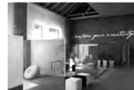
Dominika Vyhlidalová: Návrh školského klubu v podkroví bývalej varne.