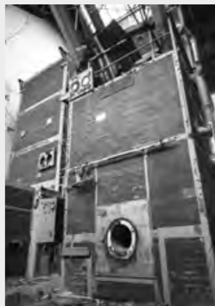
Technická pamiatka zachovaná na pôvodnom mieste v objekte kotolne - Sulzerova pec, typ z roku 1943, zo slávnej švajčiarskej firmy z Winterthuru, jediná na Slovensku.

Článok bol redakčne krátený. Plné znenie uverejňujeme v časopise Projekt.